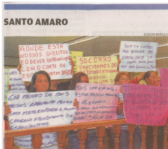
Usuários criticam corte no serviço de quatro especialidades médicas